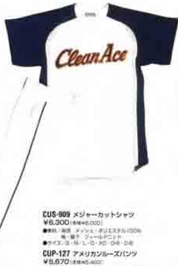
CUS-909 メジャーカットシャツ ¥6,300 (税別¥6,000)

●素材: コンストライニット・ポリエステル90%・ナイロン10% ●サイズ: S・M・L・O・XO・O8・O8