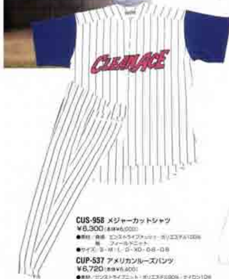
CUS-958 メジャーカットシャツ ¥6,300 (税別¥6,000)

●素材: レギュラーニット・ポリエステル100% ●サイズ: S・M・L・O・XO・O8・O8 ライン加工: W31B・W43D