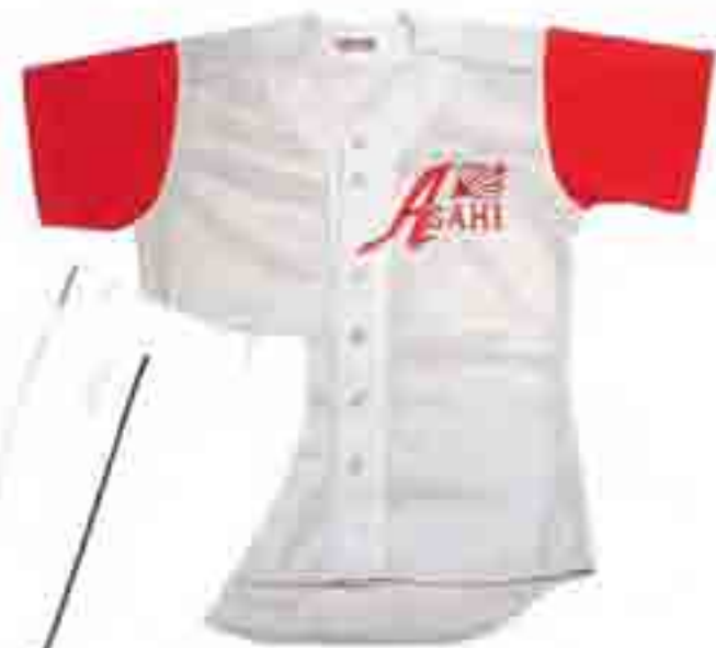
CUS-908 メジャーカットシャツ ¥6,300 (税別¥6,000)

●素材: 生地: キングコート・ポリエステル100% 裏: フェアトレード ●サイズ: S・M・L・O・XO・O8・O8